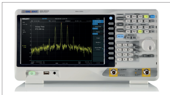
Obr. 3. Spektrální analyzátor SSA 3021X

roku, splňují vysoké požadavky na čistotu výstupních průběhů při zachování optimálních pořizovacích nákladů. Generátory lze